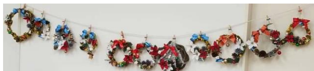
↑ 昨年参加いただいた皆さんの作品です ちっちゃなお子さんでも素敵なクリスマスリース・ツリーが簡単に作れます