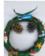
↑ 材料・工具は用意しています