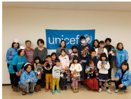
← 昨年のパーティーに参加の皆さまと